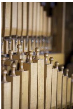
5 = Orgelpijp