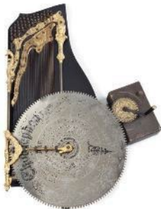
1 = Snaarinstrument