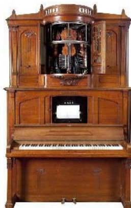
4 = Violina (viool en piano)