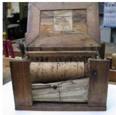
6 = Speeldoosje waarmee je een vogel kunt leren zingen