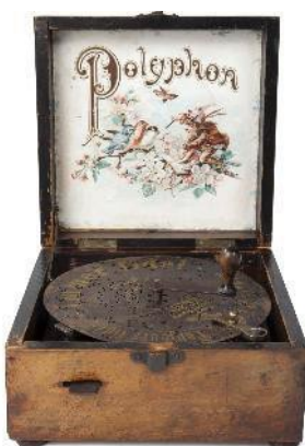
3 = Speeldoosje