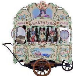
2 = Draaiorgel