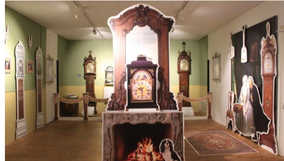
Figuur 3, Vieze liedjes op deftige speelklokken

De tentoonstellingsruimte in het museum werd voor de duur van de tentoonstelling omgebouwd tot een huiskamer van de rijkere mensen van weleer. In forex uitgesneden chique meubels, Perzische tapijten en zelfs een open haard gaven de instrumenten in de ruimte de sfeer van een dure villa uit de 18 e eeuw mee. Als de bezoekers de ruimte betraden kregen ze het gevoel alsof ze in een kijkdoos