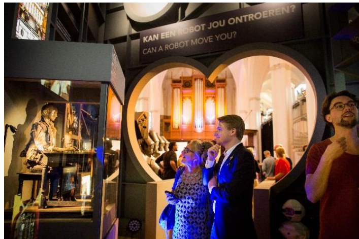
Figuur 5, tentoonstelling Robots love Music

Met de tentoonstelling Robots love Music wilden we een zinvol verband leggen tussen onze historische collectie en het actuele en toekomstgerichte thema van de robotica. We kozen daarbij voor een positieve invalshoek om zo, op een ongedwongen manier, een bijdrage te kunnen leveren aan een maatschappelijk issue. Hiermee hebben we - naast de bestaande doelgroep - een nieuwe doelgroep weten te