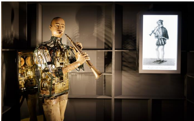
Figuur 4, opstelling Androïde Klarinetspeler

In de tentoonstelling Robots love Music stond de vraag 'Kan de robotmuzikant ons ontroeren?' centraal. De historische androïde klarinetspeler kreeg de meeste