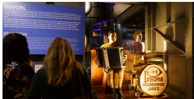
Figuur 15, exclusieve preview Double Tino

Voor de Vrienden van Museum Speelklok werden dit jaar voor het eerst twee previews georganiseerd. Zondagochtend 29 april kregen de Vrienden de gelegenheid om als eerste de pas gerestaureerde Pneuma Accordeon jazz (double Tino) te bewonderen. Deze feestelijke presentatie, als opmaat naar de tentoonstelling Robots love music , werd gevierd met taart en een muzikaal optreden.