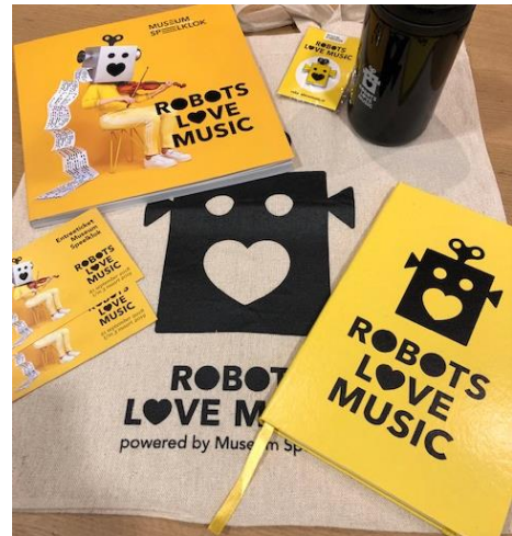
Figuur 13, merchandise artikelen

Voor de robottentoonstelling is een speciaal assortiment samengesteld dat een link met de tentoonstelling had. Hierdoor waren er in de winkel deze periode veel robotarmen, bekers, paraplu's, lampen, gummen, boeken etcetera te vinden. Naast deze collectie was er ook een klein assortiment zelf geproduceerde artikelen in de herkenbare tentoonstellingskleur(geel) te vinden. Notitieblokken, pennen, ansichtkaarten, T-shirts, bekers vlogen over de toonbank.