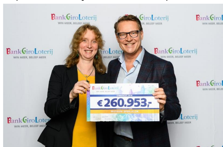
Figuur 14, gulle donatie van de BankGiro Loterij in 2018

Via geormerkt werven ontving het museum nog een extra bijdrage van € 60.953 die vrij besteedbaar is.