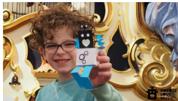
Figuur 8, muziekdoosjes versieren