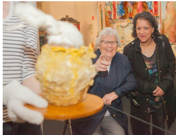
Figuur 6, Vrijdag Museumdag