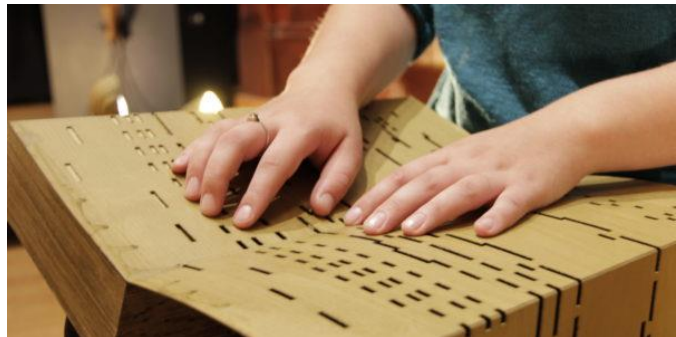
Figuur 7, project Tastbare Muziek

De organisatie Bartimeus heeft een adviesrapport geschreven voor het verbeteren van de toegankelijkheid in het gebouw en voor de verlichting van Museum Speelklok. Verschillende voorstellen die in het rapport zijn aangedragen, zijn inmiddels opgenomen in het onderhoudsplan voor 2019.