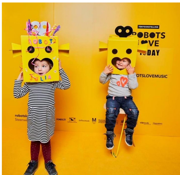
Figuur 11, gele robohoofden

Het Utrechtse ontwerpbureau Today ontwierp een zeer herkenbaar campagnebeeld dat doorgevoerd werd in diverse middelen. Ook werd er een