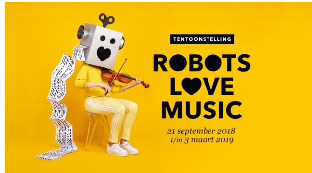
Figuur 1, campagnebeeld Robots love Music

In alle opzichten was ons robotjaar een succes: ruim 9.000 extra bezoekers in 2018, veel media-aandacht uit binnen- en buitenland, een veelzijdig en boordevol randprogramma en geslaagde samenwerkingen met partijen in de stad. Dat iedereen de smaak te pakken heeft, blijkt wel uit de veel gestelde vraag: wat is jullie volgende grote project?