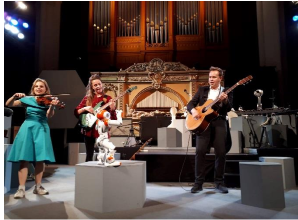
Figuur 10, Koppie Koppie Robotkoppie