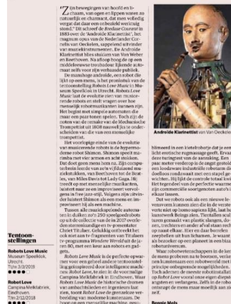
Figuur 12, NRC Handelsblad